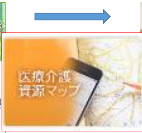
4月1日以降のホームページ画面

川薩医療・介護事業所のネットワーク公開がいよいよ始まります。各事業所へ専門職用のユーザー名・パスワードをお届けし、情報に間違いがないか確認をして頂いております。薩摩郡医師会のホームページ画面からも入れますので、ご活用ください。それに伴い、トップページのデザインを少し変更致しました。「医療介護資源マップ」(上図)より検索できます。(支援センター)