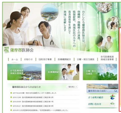
これまでのホームページ画面

4月1日から薩摩郡医師会ホームページより「医療介護資源マップ」で事業所検索が出来るようになります。